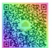
Конкурс "Лучший сметчик"