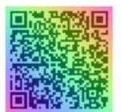
Вебинары с экспертами ГАУ "УГЭЦ РТ"