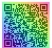
Онлайн школа для начинающих сметчиков